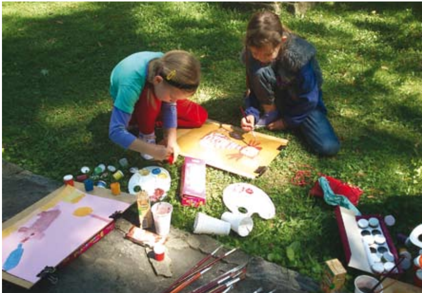
Podczas Pleneru malarskiego w Parku Pokoju.