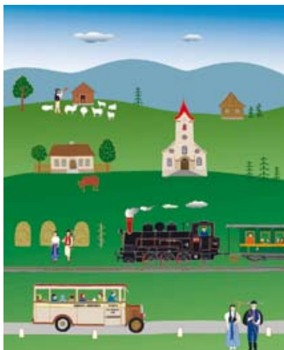
Praca autorstwa Antoniego Szpyrca.