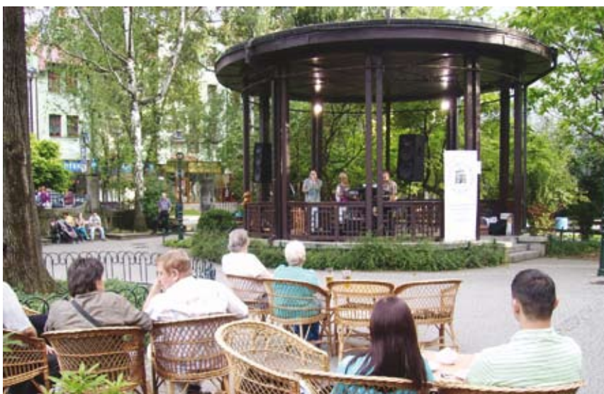
Popołudnia w Parku Pokoju spędzono przy dźwiękach muzyki, m. in. zespołu The Beskids.