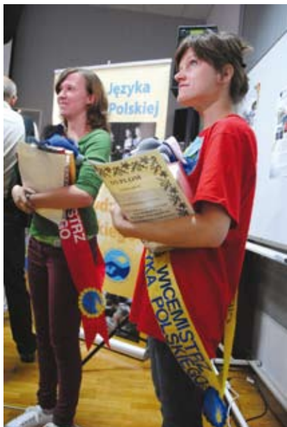
Laureatki 15. edycji konkursu „Sprawdzian z polskiego”.