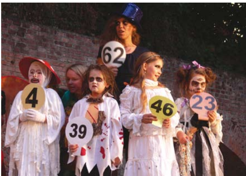
Dzieci świetnie się bawiły przebierając się za... straszydła.