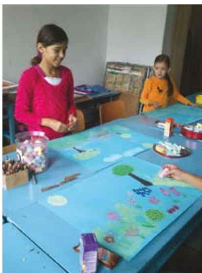
Zajęcia z malarstwa w Domu Narodowym.