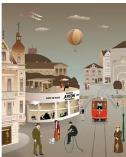
Grafika Władysława Szpyrca.

W Galerii Cieszyńskiego Ośrodka Kultury „Domu Narodowego” od 6 września będzie można zobaczyć wystawę malarstwa na szkle Antoniego Szpyrca i grafiki Władysława Szpyrca.