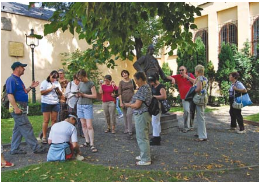
Znane i nieznanne zakątki Cieszyna zwiedzano z przewodnikami PTTK.