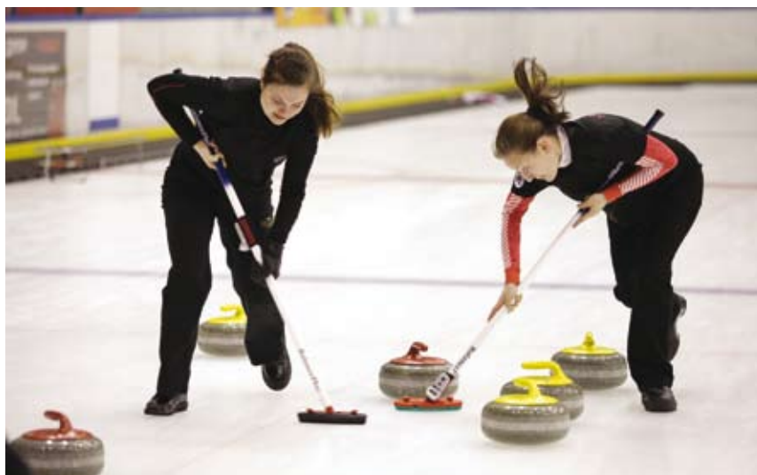
Najlepsi curlerzy w Polsce zagospzczą już wkrótce na tafli lodowej w Cieszynie.

Na rozpoczęcie sezonu zimowego w Hali Widowiskowo – Sportowej im. Cieszyńskich Olimpijczyków (ul. Sportowa 1) rozegrane zostaną Finały Mistrzostw Polski Juniorów i Seniorów w curlingu. Codziennie w dniach 14-16 września na tafli lodowej rywalizować będą najlepsi curlerzy w Polsce. Wstęp wolny. Zapraszamy! MOSiR