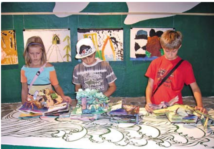
Z wizytą na wystawie w Zamku Cieszyn.