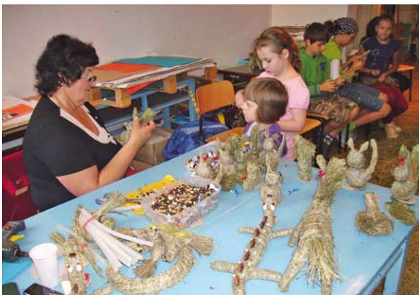
Nauka wyplatania zwierzątek z sianka.