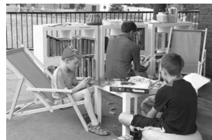
W dwa wrześniowe weekendy czynna będzie letnia czytelnia.

Zapraszamy do letniej czytelnia przed budynkiem dawnej strażnicy na Moście Przyjaźni przed Świątlicą „Krytyki Politycznej” Na Granicy (ul. Zamkowa 1) w dniach 1-2 oraz 8-9 września (soboty: 16.00-20.00, niedziele 12.00-16.00).