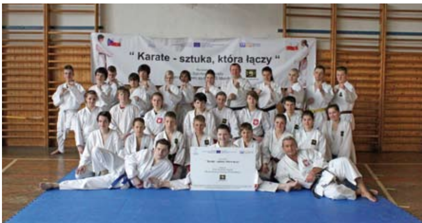
Przez 6 miesięcy karatecy z Shindo współpracowali z klubem z Karviny.