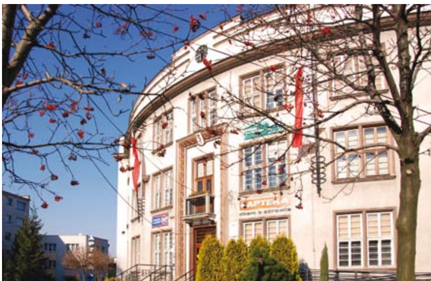
Bezpłatny przewodnik szlakiem cieszyńskiej architektury modernistycznej (na którego trasie znajduje się m. in. budynek przy ul. Bielskiej 37) to najnowsza publikacja Wydziału Promocji i Informacji Urzędu Miejskiego. Można go otrzymać w Cieszyńskim Centrum Informacji lub w Ratuszu.

Najprawdopodobniej zaopiniował go sam Camillo Sitte, wybitny wiedeński architekt, urbanista i historyk sztuki. Jako jeden z pierwszych zobaczył wyzwania stojące przed dynamicznie rozwijającymi się miastami. Uważany jest za ojca współczesnej teorii urbanistyki. Podobnie jak inny wybitny planista wiedeński, mianowicie Max Fabiani, dostrzegał potencjał kulturowy i estetyczny, który można wydobyć na drodze racjonalnego planowania miasta. Camillo Sitte przygotował również plany dla Ołomuńca, Ostrawy i Brna.