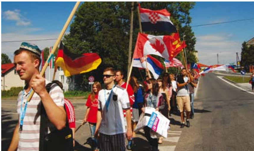
Studenci 22. letniej szkoły języka, literatury i kultury polskiej idący barwnym korowodem na cieszyński rynek