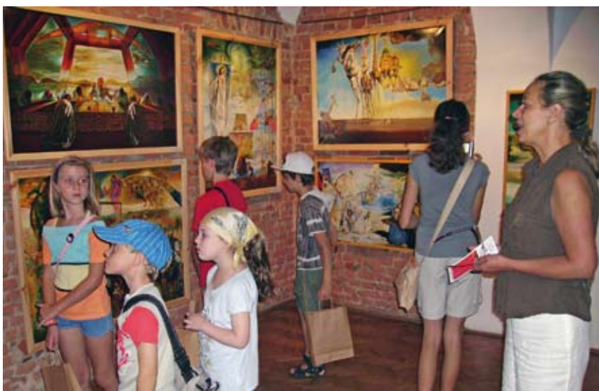
Spotkania dzieci ze sztuką.