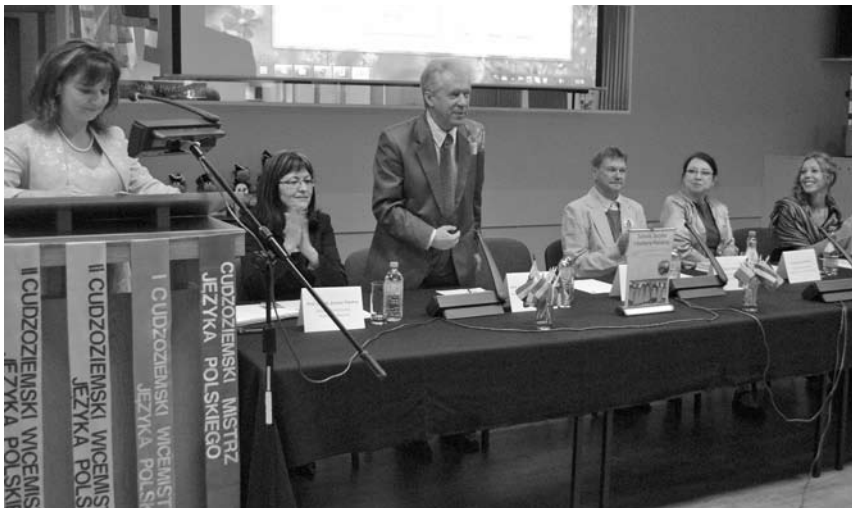
Jury 15. jubileuszowej edycji międzynarodowego konkursu ortograficznego „Sprawdzian z polskiego”.