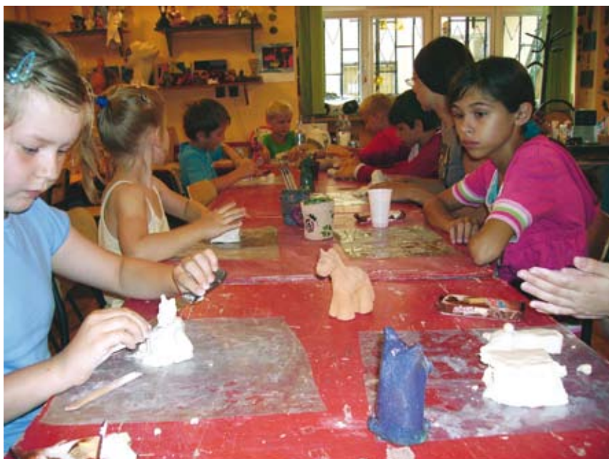
W czasie „Letniego spotkania z ceramiką”

W czasie tegorocznych wakacji Cieszyński Ośrodek Kultury „Dom Narodowy” przygotował bogatą i ciekawą ofertę różnorodnych imprez dla najmłodszych.